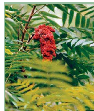
Sumac vinaigrier

L'inflammation de la peau est le résultat de la réponse immunitaire du corps humain aux cellules contaminées. La dermatite n'est donc pas transmise à un autre individu par le contact des plaies, sauf si l'urushiol est encore présent sur la surface de la peau. Un grand nombre d'animaux et d'oiseaux sont complètement insensibles, parce que leur système immunitaire est différent de celui des humains.