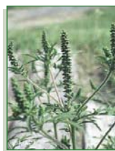
HERBE À POUX

Il ne faut pas confondre l'herbe à la puce et l'herbe à poux. Le pollen de cette dernière est la principale cause de rhinite allergique saisonnière, communément appelée rhume des foins. Contrairement à l'herbe à la puce, on peut sans danger arracher l'herbe à poux à mains nues.